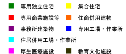
図2. 典型街区の紹介