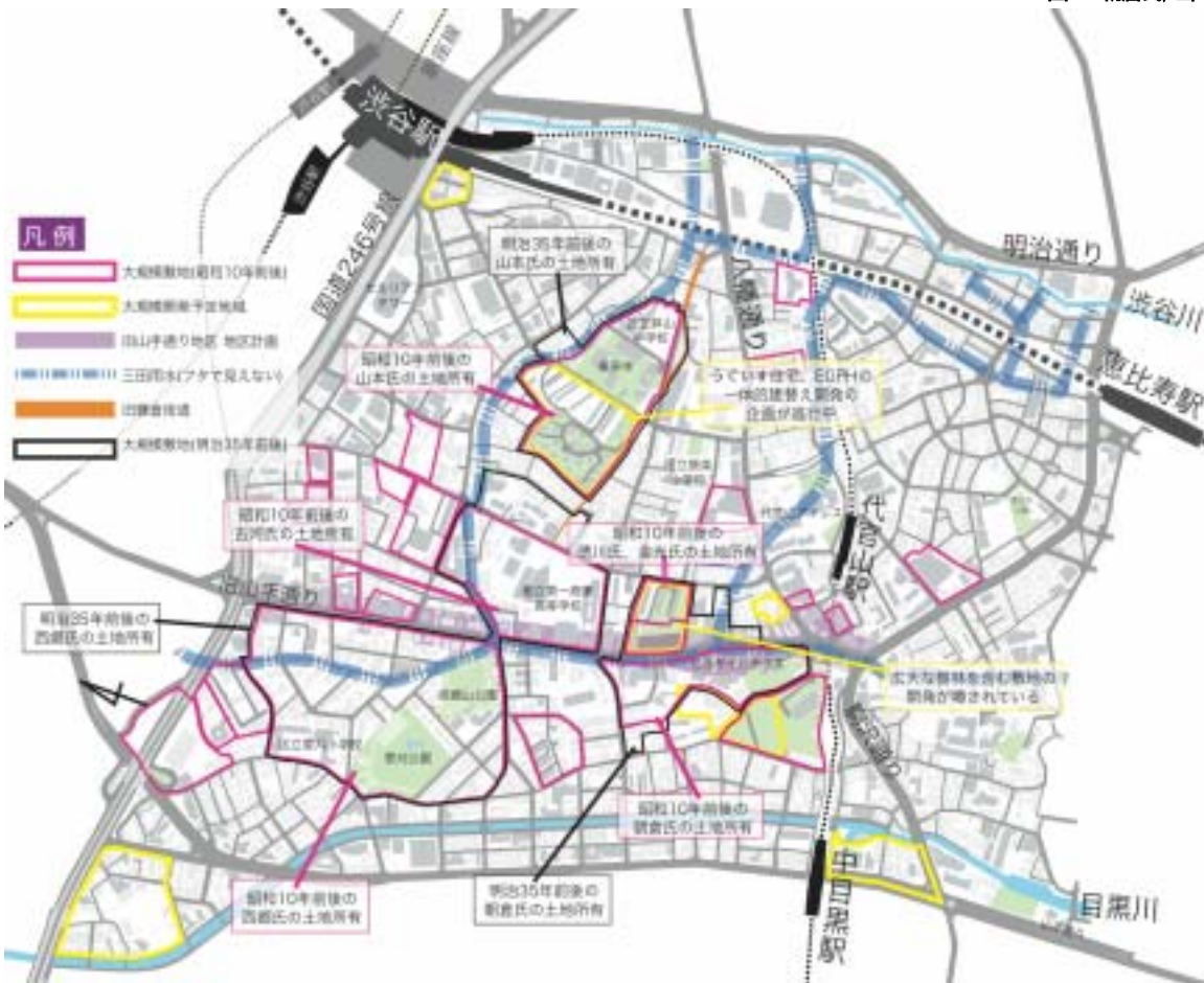
図3 代官山地域の大規模所有地の変遷と大規模開発予定地域