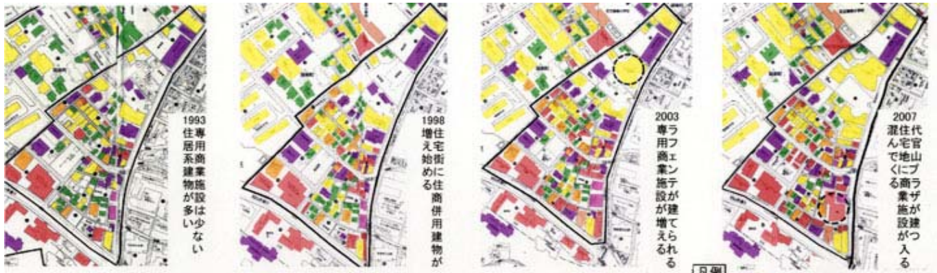
(図1)住宅市街地の変容