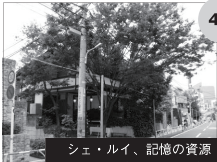
シェ・ルイ、記憶の資源 Bコース (11票 : 4 / 7)