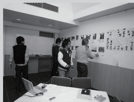
写真展会場の様子

会場には、各回で選ばれた代官山のステキな景観の写真を展示し、来場いただいた方にステキだと感じる景観写真に投票していただきました。散歩がてら立ち寄ってくださった方々のほか、成果報告時には30名ほどの参加があり、代官山らしい景観についての意見交換に花が咲きました。