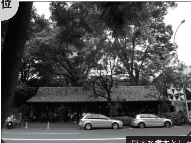
巨大な樹木としゃれたカフェ Aコース (14票 8/6)