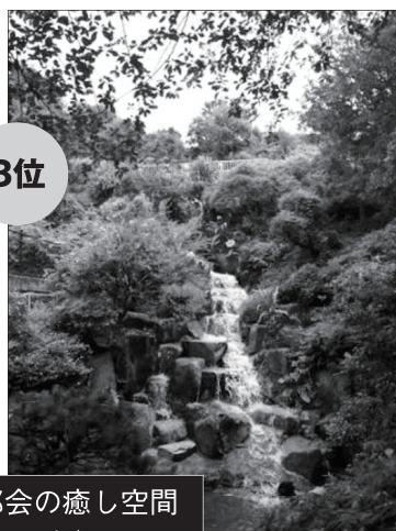
西郷山公園の滝水、都会の癒し空間 Aコース (12票 : 4 / 8)