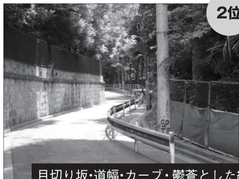
目切り坂・道幅・カーブ・鬱蒼とした緑 Aコース (13票 : 6 / 7)