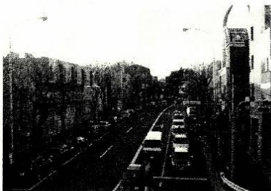
歩道橋より各方面を見る 旧山手通り

代スキ会では、昨年10月に「八幡通り」を取り上げました。そして、続く12月には「変わりゆく代官山」として、開発が進む代官山をテーマに皆さんのご意見をうかがいました。それらを通じて、いくつか解ってきたことがあります。その一つが、代官山が発展していく中で生まれた負荷の多くが、八幡通りに集中しているということです。違法駐輪駐車、ゴミ問題、渋滞、人ごみ、等々…。他の場所に比べても、八幡通りの問題の多さは突出しています。 しかし、八幡通りの問題は八幡通りのことだけを考えていても解決しません。八幡通りの問題は、代官山地域全体の問題なのです。私も代スキ会では、代官山地域全体のことを考えることによって見えてくる、八幡通りのあるべき姿をデザインすることを、一つの目標にしていきたいと思えます。代官山の人口は増える一方です。それに耐えうるインフラは代官山に整備されているのでしょうか？飽和状態を迎えつつあるこの「まち」に対して、私たちは何を考え、何をなしておくべきなのでしょう？